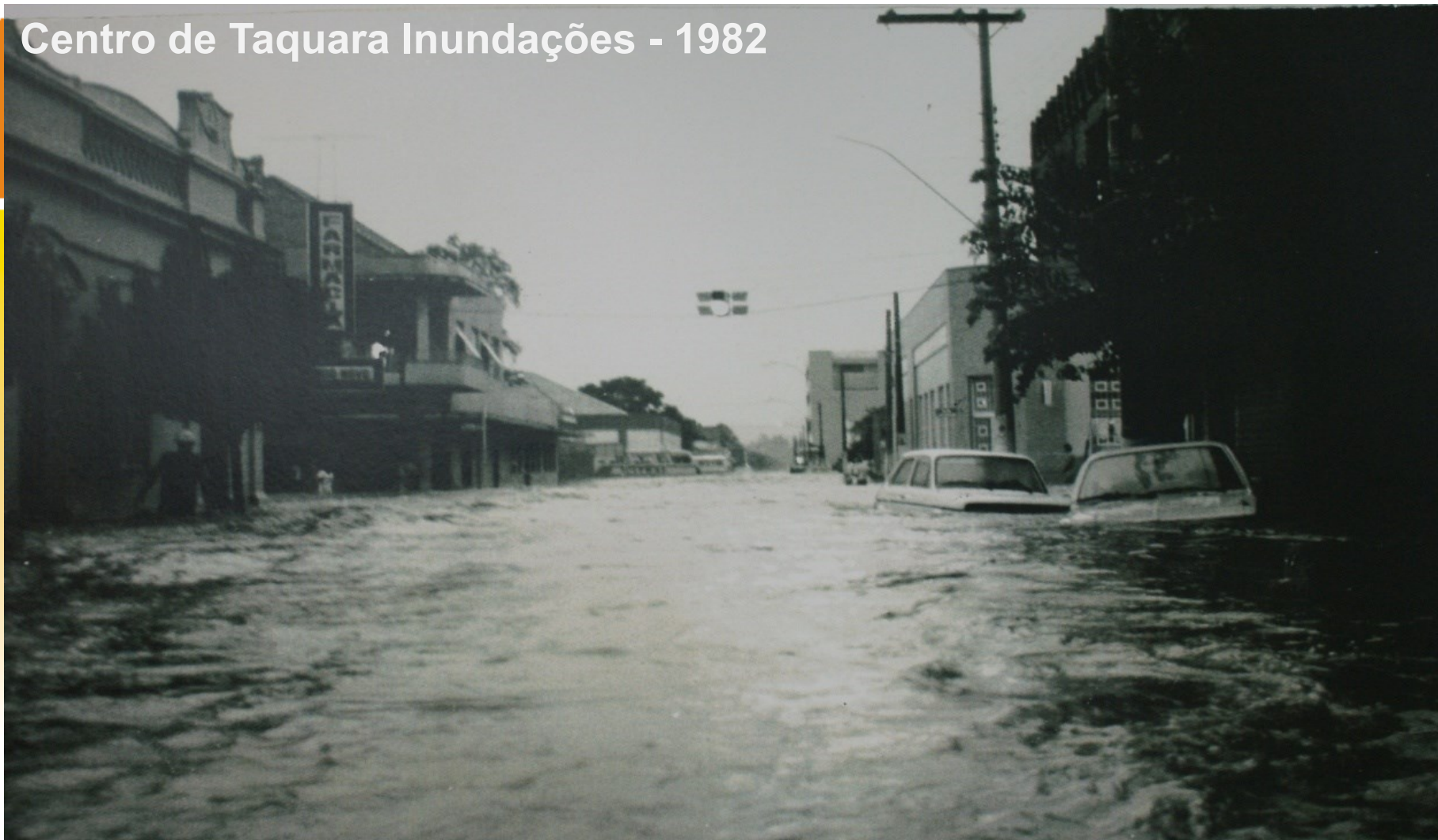
Centro de Taquara Inundações - 1982