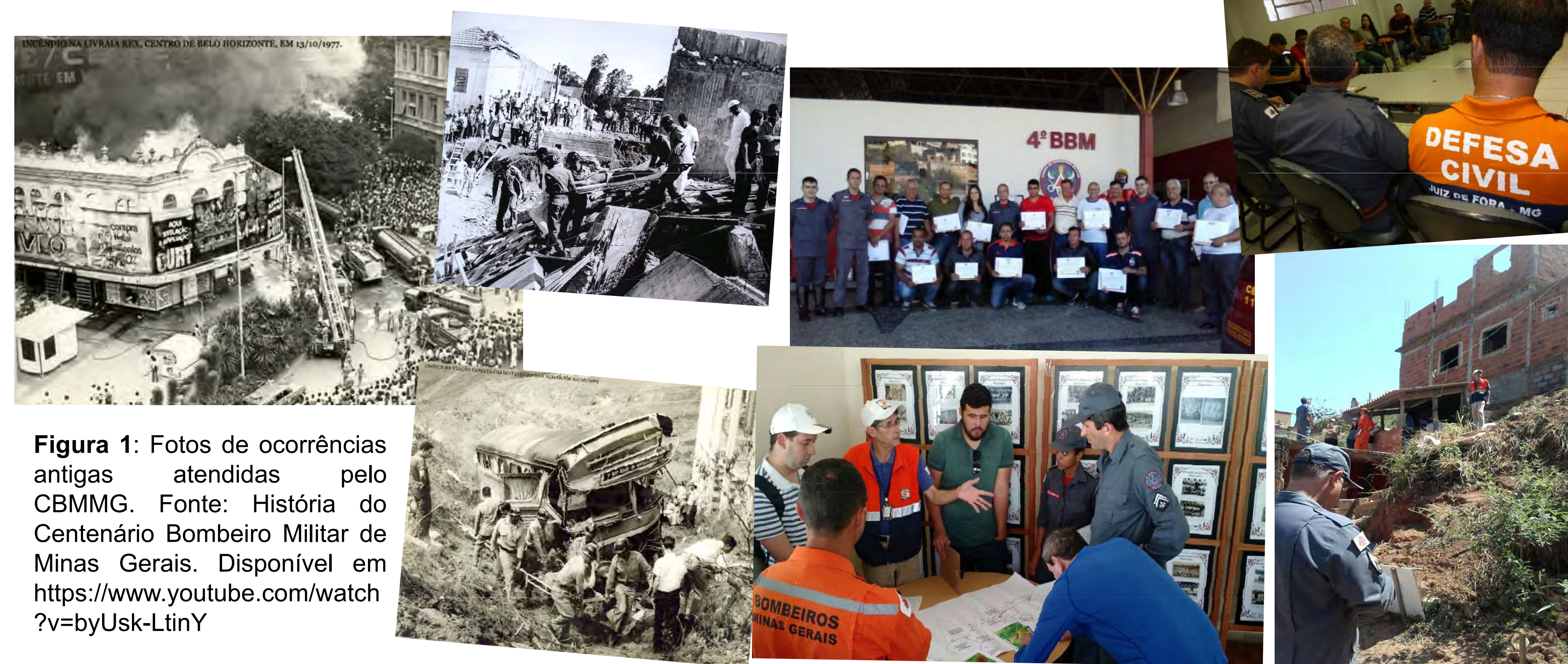
Figura 1: Fotos de ocorrências antigas atendidas pelo CBMMG.

Pesquisa qualitativa da história e normas do Corpo de Bombeiros Militar de Minas Gerais (CBMMG), do SAMU e da Defesa Civil sendo órgãos afins com atribuições de prevenção, preparação e respostas a acidentes e desastres. Gestão em rede abordada no modelo de governança em rede de segurança pública em Minas Gerais. Pesquisa quantitativa dos registros de ocorrências atendidas pelas três instituições. Estudo de caso confrontando a teoria com fatos e dados reais.