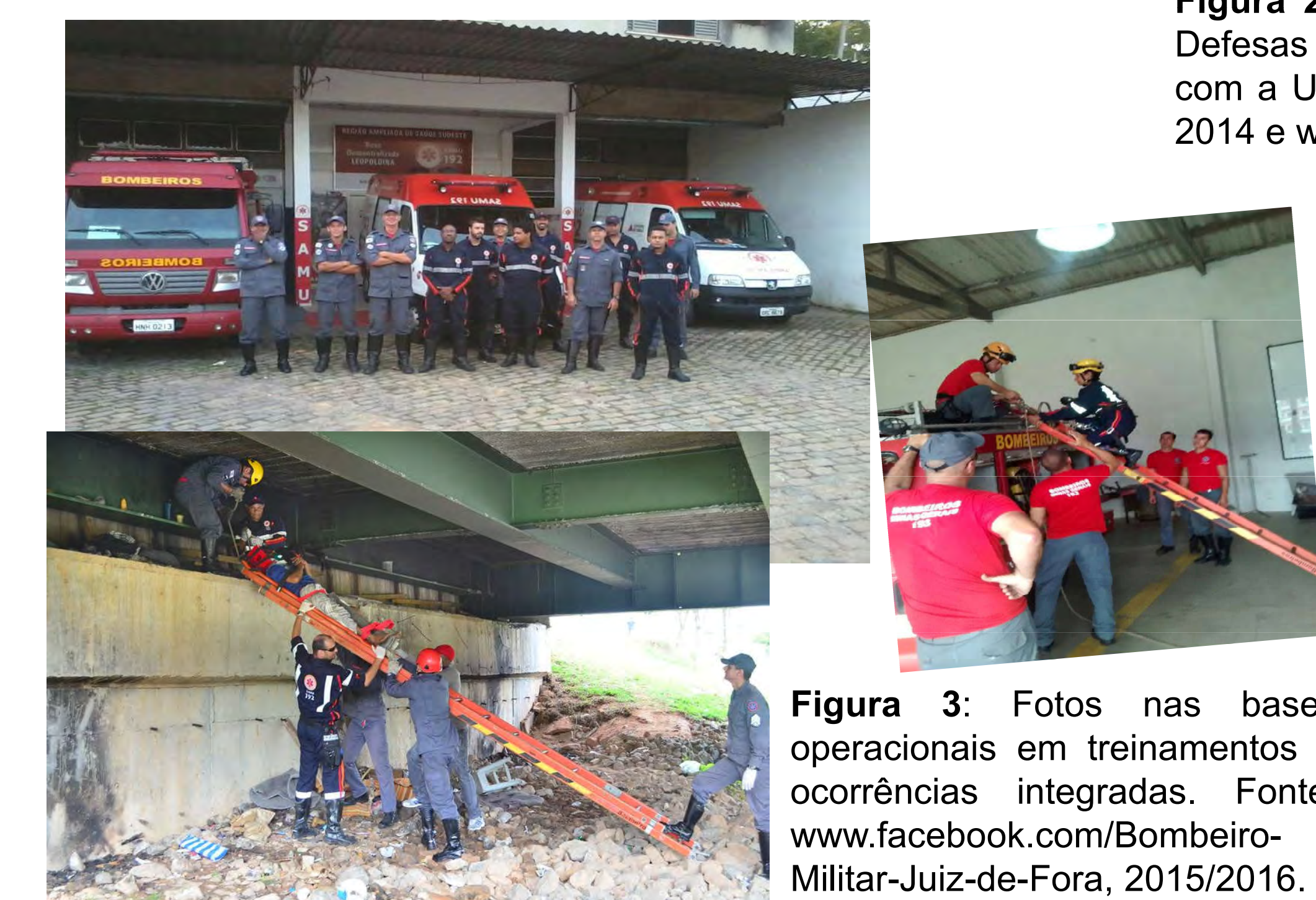
Figura 3: Fotos nas bases operacionais em treinamentos e ocorrências integradas. Fonte: www.facebook.com/Bombeiro-Militar-Juiz-de-Fora , 2015/2016.