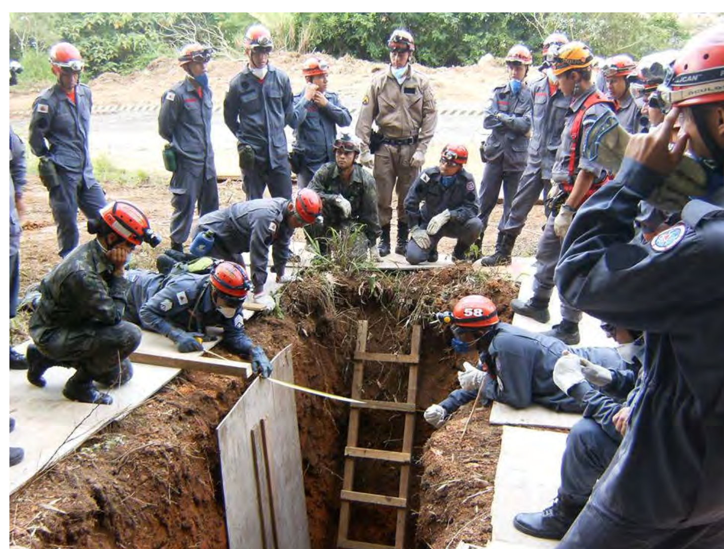
Figura 4: Foto de treinamento de Resposta a Desastres ministrado pelo 4º BBM a integrantes do Bombeiro Militar, Exército, Polícia Militar, SAMU e Defesa Civil. Fonte: www.facebook.com/Bombeiro-Militar-Juiz-de-Fora , 2016.